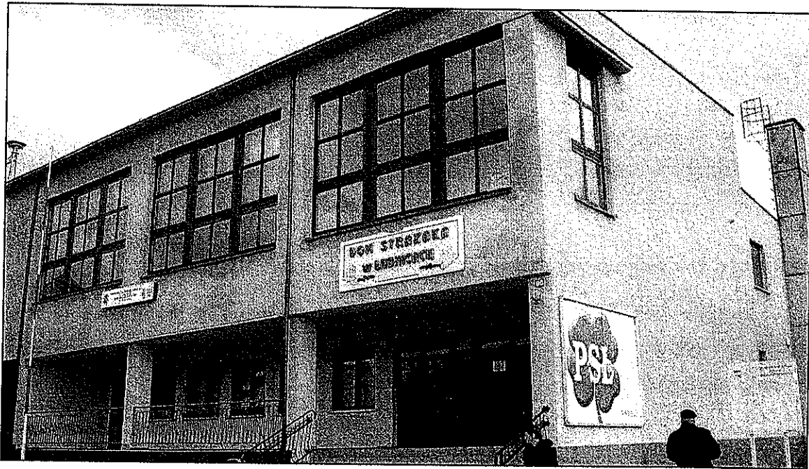
Dom Strażaka w Lubnicach

„Przebudowa z rozbudową budynku Domu Strażaka”.