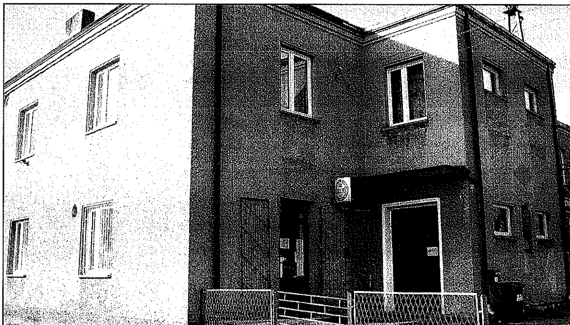
Dom Strażaka w Kolonii Dzierzkowice

„Przebudowa z rozbudową Domu Strażaka i utworzenie w budynku świetlicy wiejskiej z dostępem do Internetu i siłownią.”