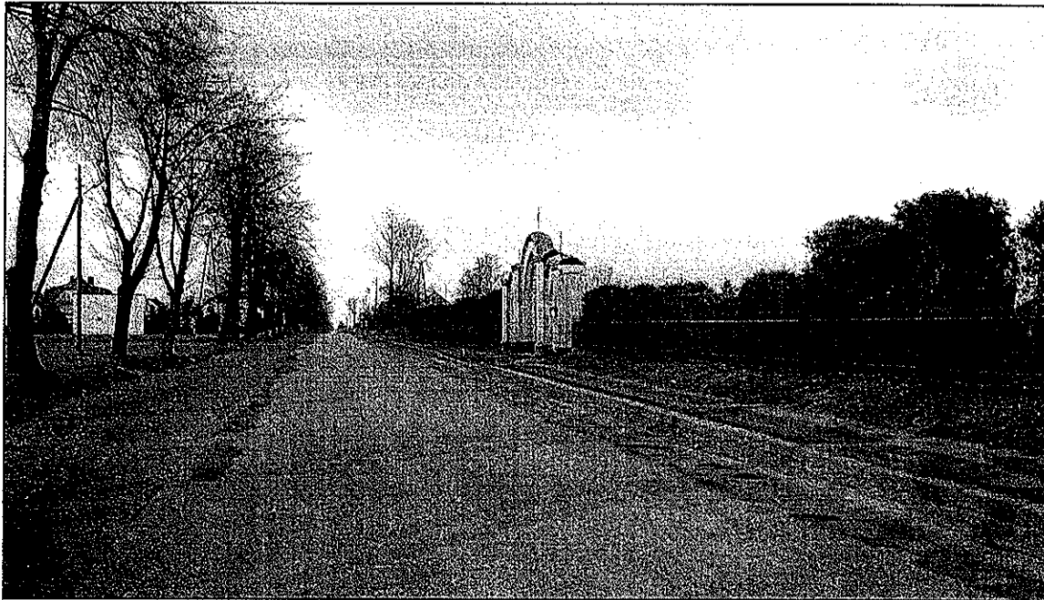
Cmentarz w Andrzejowie