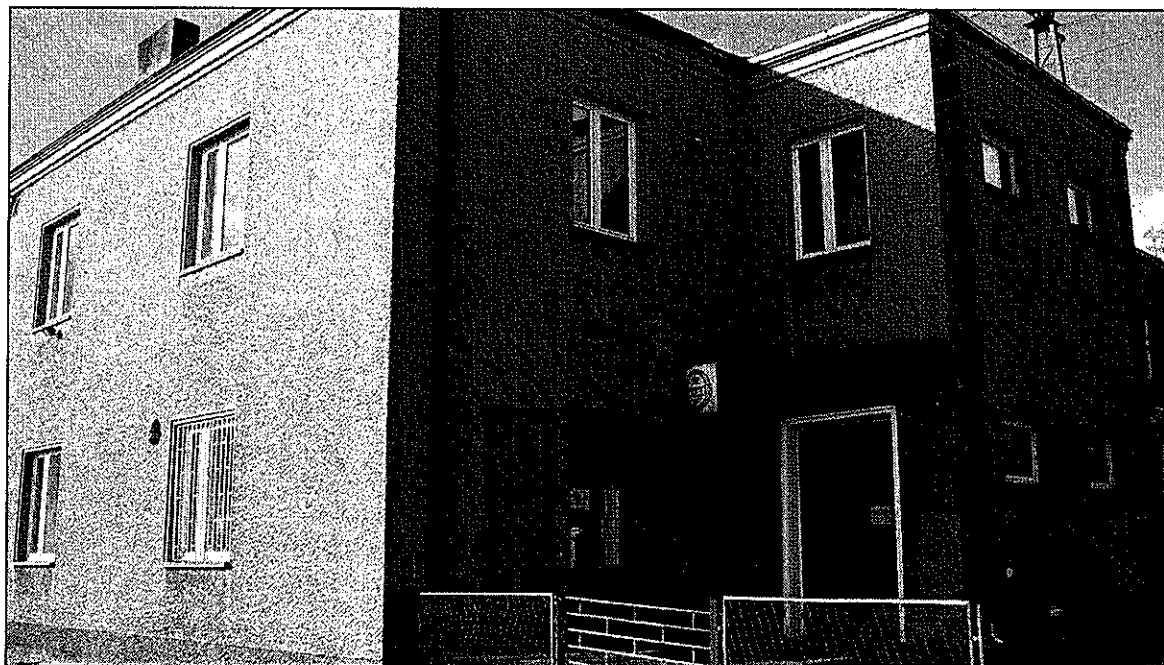
Budynek OSP w Kolonii Dzierzkowice

„Rozbudowa i przebudowa z termomodernizacją budynku OSP z przeznaczeniem na Centrum Kultury wsi Kolonia Dzierzkowice”