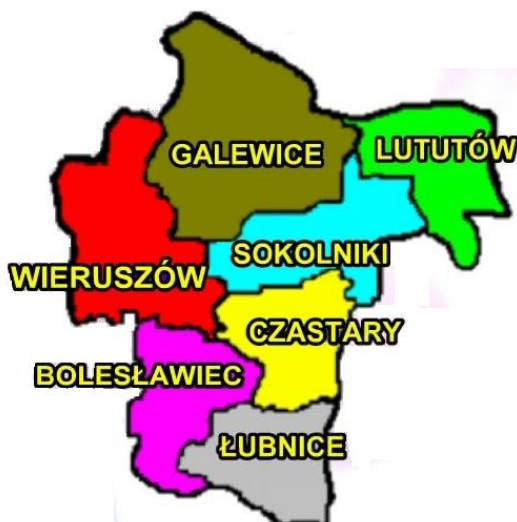
Rys. 1 Gmina Łubnice na tle powiatu wieruszowskiego.

Gmina Łubnice ma charakter wiejski. Położona jest w południowo-wschodniej części powiatu wieruszowskiego oraz południowo-zachodniej województwa łódzkiego – przy granicy z województwem opolskim.