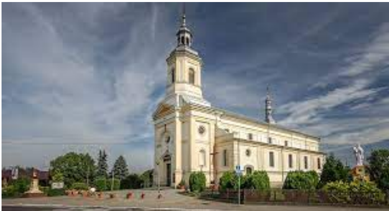
Rysunek Kościół parafialny w Dzietrzkowicach

Spośród budowli znajdujących się na terenie gminy Łubnice najistotniejsze znaczenie dla jej tożsamości i dziedzictwa posiadają w szczególności budowle o funkcji sakralnej. W nich też znajdują się najcenniejsze dla Gminy zabytki ruchome.