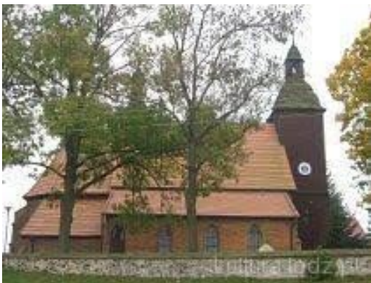
Rysunek Kościół parafialny Wniebowzięcia NMP w Łubnicach