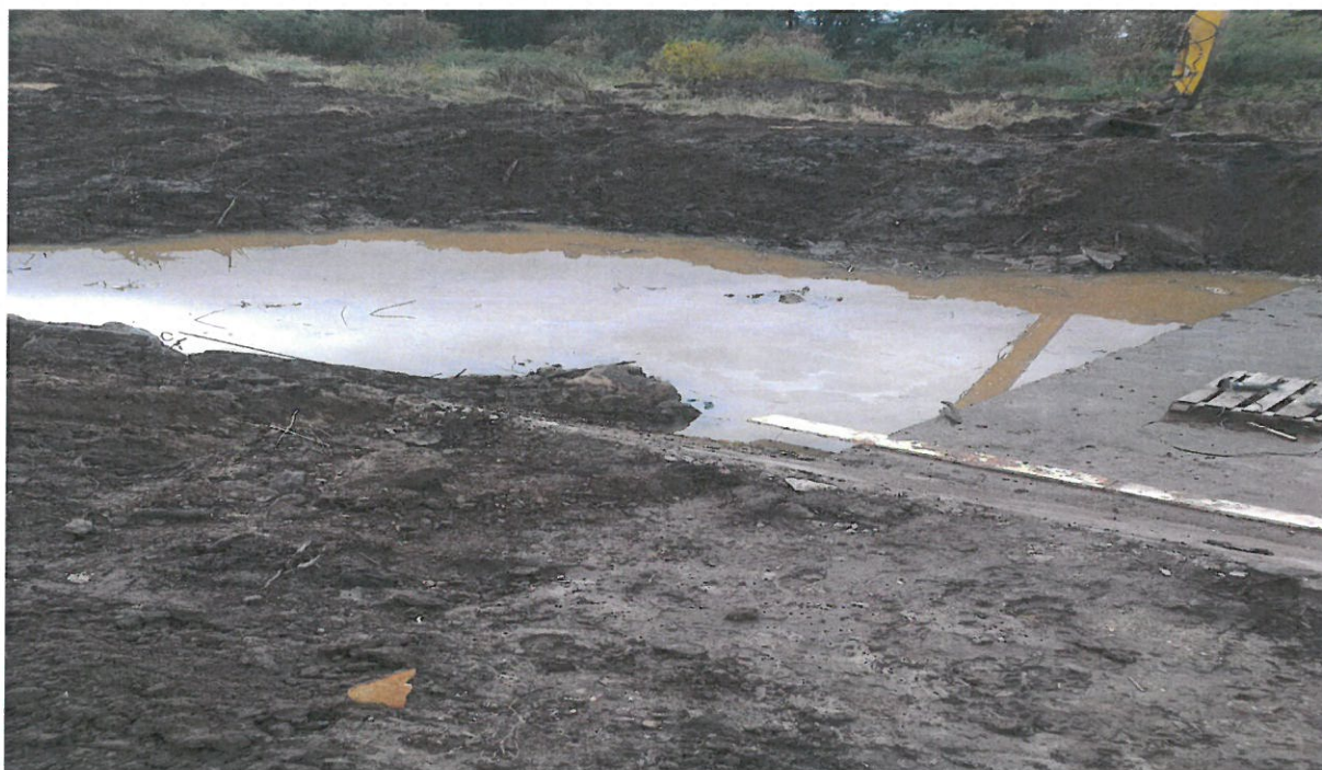
3. Zdjęcie rzeki Prosny w miejscowości Łubnice (Krupka) obecnie w trakcie robót budowlanych.

Wniosek: Wody płynące rzeki Prosny nie nadają się do kąpieli. Miejsca nie wymagają szczególnego nadzorowania, na wszelki wypadek zostaną oznakowane w trzech miejscach tj. Dzierzkowice (Bezula), Łubnice (Krupka) oraz w Wójcinie przy moście, by ostrzec potencjalne osoby, które chciałyby skorzystać z niego niezgodnie z przeznaczeniem.