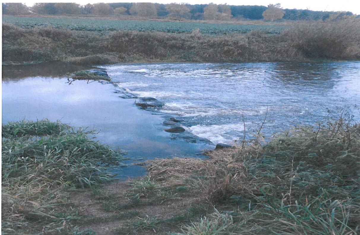
1. Zdjęcie rzeki Prosny w miejscowości Dietrzkowice (Bezula).

Prosna jest nizinnym szlakiem kajakowym, dostępnym od Wieruszowa do Pyzdr na odcinku 150 km. Przebiega głównie w otoczeniu pól i łąk w większości w szpalerach wierzbowych. Prosna na terenie Gminy Łubnice przepływa przez miejscowości: Wójcin, Łubnice i Dietrzkowice. Rzeka nie sprzyja kąpielom. Jej brzegi porośnięte są gęstą roślinnością szuwarową, dno jest zatorfione i muliste. Prosna poza „wielką wodą”, nigdy nie wygląda groźnie i nie budzi obaw, dlatego też dla wielu osób rzeka posiada nieodparty urok, będąc miejscem wypoczynku, wędkowania i spacerów nad jej nurtem. Na rzece znajdują się trzy mosty i tama, obecnie w trakcie modernizacji, które można potraktować jako miejsca okazjonalnie wykorzystywane do kąpieli (dzikie kąpieliska). Do rzeki przylegają działki będące własnością prywatną. Akwen wodny nieoznakowany i niestrzeżony.