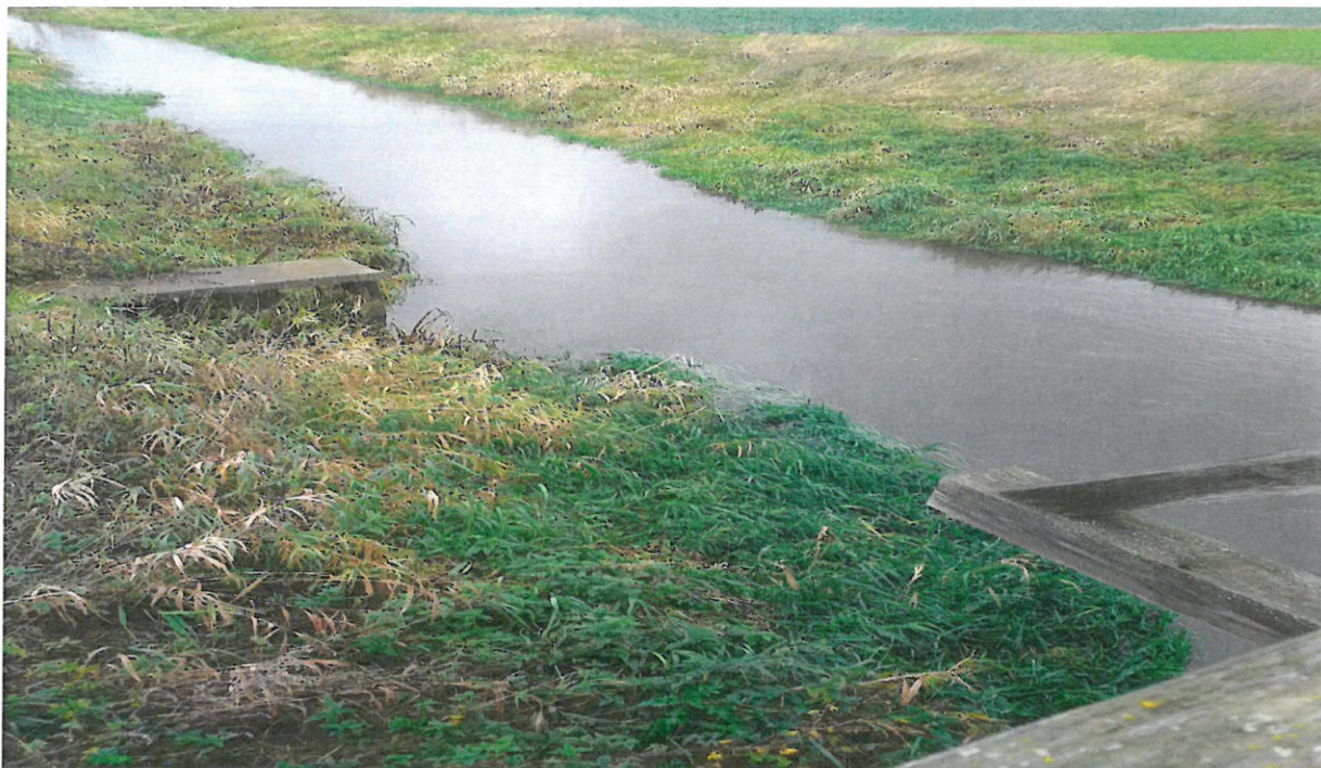
2. Zdjęcie rzeki Prosny w miejscowości Wójcin (przy moście).