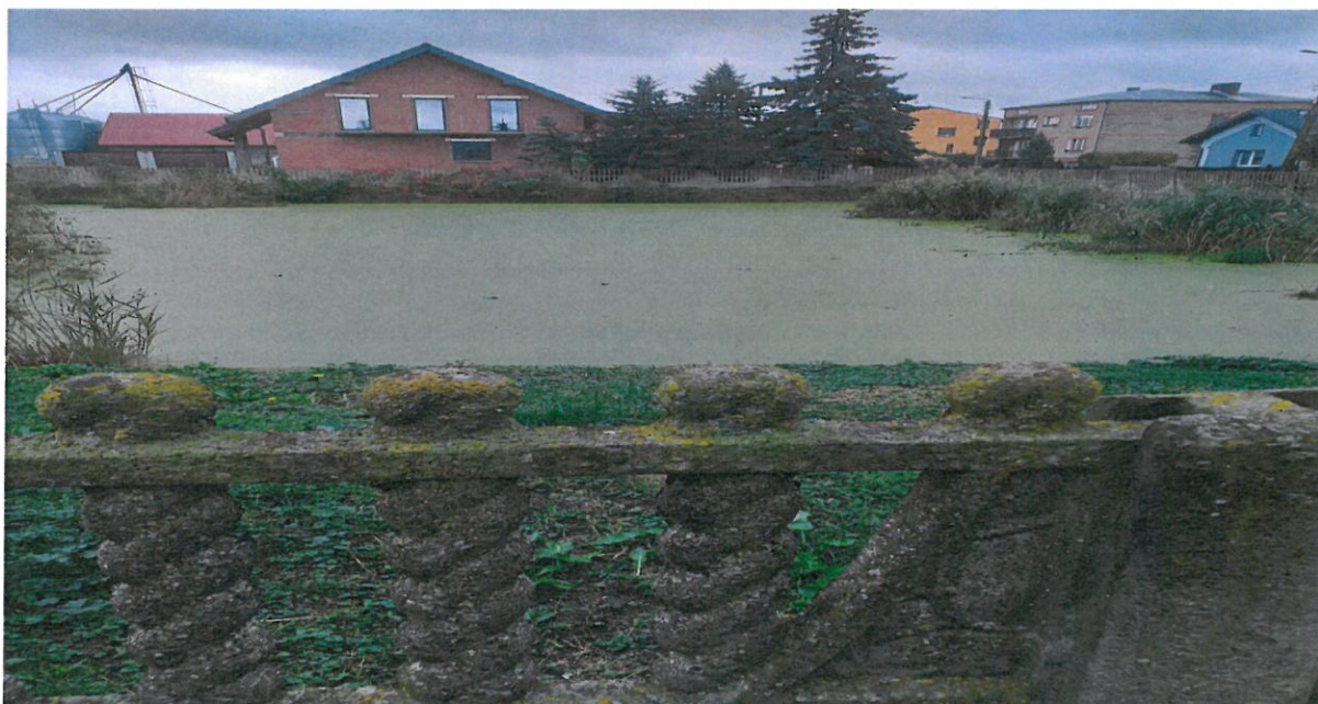
4. Zdjęcie zbiornika przeciwpożarowego w miejscowości Łubnice.

Na terenie Gminy Łubnice znajduje się zbiornik wodny przeciwpożarowy (pełniący funkcję dodatkowego źródła wody), położony na terenie działki nr 341, obręb Łubnice należącej do Gminy Łubnice. Dojście do zbiornika od ul. Piastowskiej, zejście do zbiornika schodkowe, przeznaczone dla strażaków nabierających wodę do beczkowsów. Dno zbiornika mocno zamulone i porośnięte roślinnością. Zbiornik nie nadaje się do kąpieli. Teren jest ogrodzony, nieoznakowany tabliczką „Zakaz kąpieli”. Akwen wodny nieoznakowany i niestrzeżony.